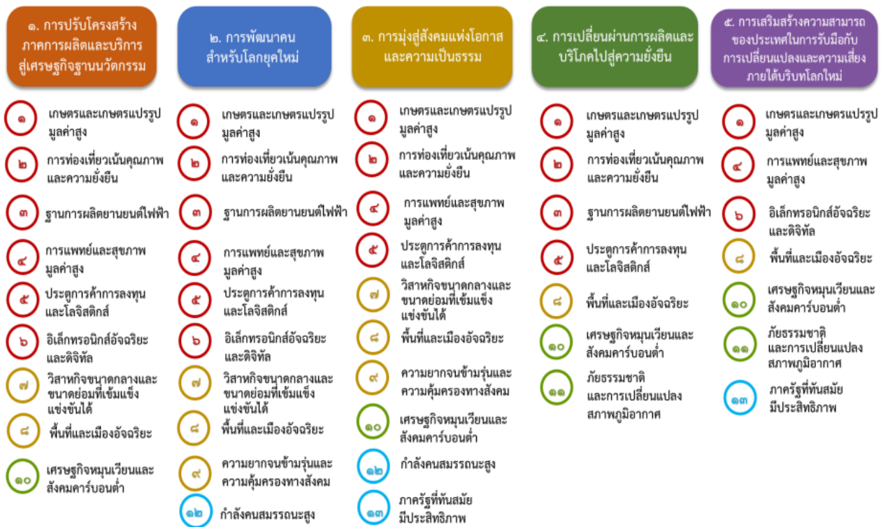
แผนภาพที่ ๓.๑ ความเชื่อมโยงระหว่างหมวดหมู่การพัฒนากับเป้าหมายหลัก

ความเชื่อมโยงระหว่างหมวดหมู่การพัฒนากับเป้าหมายหลักแสดงไว้ในแผนภาพที่ ๓.๑ โดยหมวดหมู่ การพัฒนาที่กำหนดขึ้นเป็นประเด็นที่มีลักษณะเชิงบูรณาการที่ครอบคลุมการพัฒนาตั้งแต่ในระดับต้นน้ำจนถึง ปลายน้ำ และสามารถนำไปสู่ผลพัฒนาทั้งในมิติเศรษฐกิจ สังคม ทรัพยากรธรรมชาติและสิ่งแวดล้อมไปพร้อมๆ กัน ทำให้หมวดหมู่แต่ละประการสามารถสนับสนุนเป้าหมายหลักได้มากกว่าหนึ่งข้อ นอกจากนี้การพัฒนาภายใต้ แต่ละหมวดหมู่ไม่ได้แยกขาดจากกัน แต่มีการสนับสนุนหรือเอื้อประโยชน์ซึ่งกันและกัน